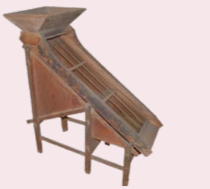
教祖様ご使用の農具(万石通し)

そして、4年後の安政6年(1859)、人間一人ひとりが抱える問題を神様に届け、神様の願いを人間に伝える中で、人間の助かりを生み出していくお働きである「取次」への専念を、神様からお頼みになられ、教祖様は謹んでお受けになりました。このお頼みを金光教では「立教神伝」といい、この日を金光教立教の日としています。